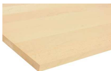
Multiplis de Hêtre